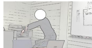
Ridläraren spelar rollen av en häst som gör en öppna. Armarna utgör hästens framben och beinen utgör hästens bakben.

På bilden nedan ser vi en (anonymiserad) ridlärare som under en teori-lektion spelar rollen av en häst som gör en rörelse öppna . Anledningen till att det inte räcker att förklara muntligt är att det är svårt att i exakt detalj förklara hur en rörelse ska utföras eller hur någonting ska kännas. Där måste det talade språket kompletteras med de kroppsliga resurserna.